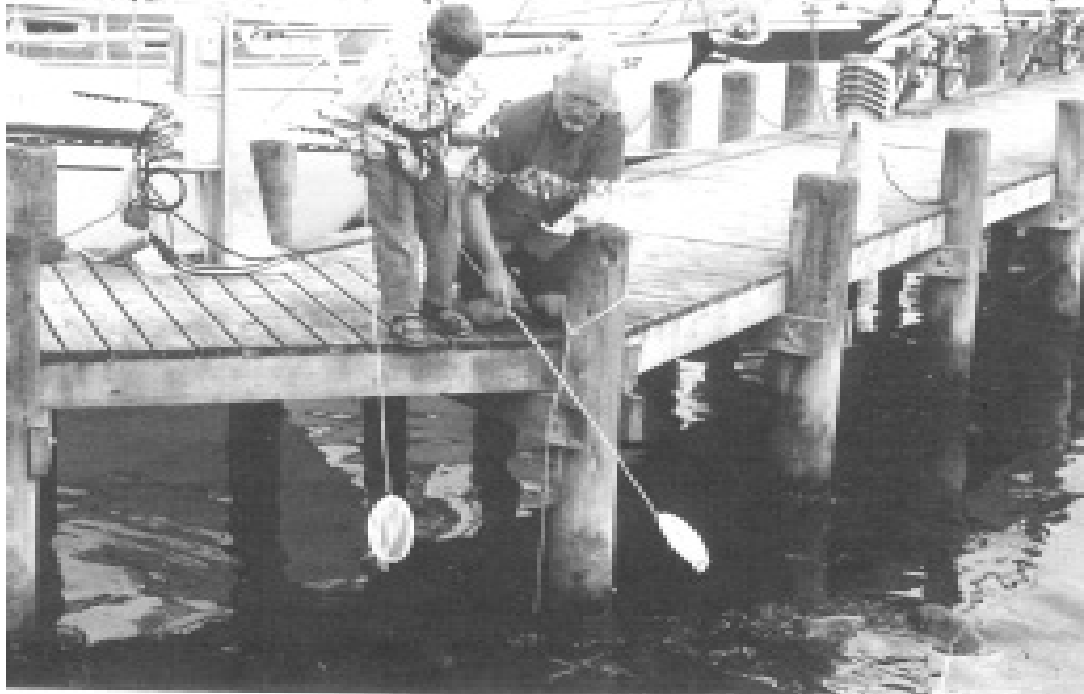
Nogen skal jo sørge for provianten

Mandag kikker vi os lidt omkring i den lille by og dagen efter tager vi så, i strålende sol, resten af Samsø – på cykel. Ca. 45 km bliver det til, men så er vi også både trætte, solskoldede og har ømme bagdele, så aftensmaden nydes på en af Ballens restauranter, roterende rundt på stolene for at finde den mindst ”ømme plet”. Som vi forlader restauranten begynder det at smådryppe, for kort tid efter at slå over i det mest fantastiske tordenvejr, vi endnu har oplevet. Folk står på deres både og kikker ud over havet for at beundre vejret, for det lyner og tordner, som var det en ny blitz – denne gang bare over Samsø. Uvejret bliver fulgt op af et vanvittigt regnvejr og vindstød på op til 25 m. pr.