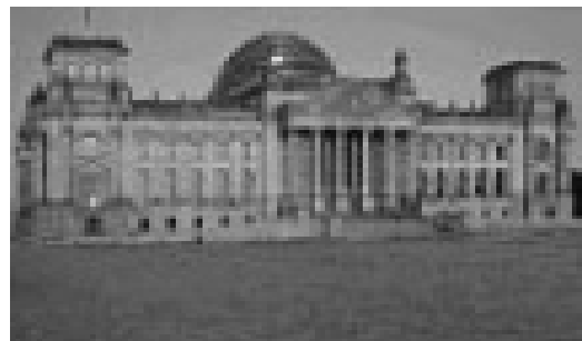
Rigsdagsbygningen i Berlin

Næste morgen vågnede vi igen med solen stående højt på himmelen. De store turistbåde kom sejlede tæt forbi os, det gav en speciel stemning. Vi må på opdagelse, der var fuld gang i både kaptajnen og mandskabet. Vi så alle de berømte bygninger fra vandsiden, op til flere gange sejler vi frem og tilbage for at beundre dem fra alle sider, "Domkirken, Banegården, Kongreshallen, Regeringsbygningen med den store glaskuppel, de nordiske ambassader og fjernsynstårnet på Alexander plaz. Det hele var overvældende.