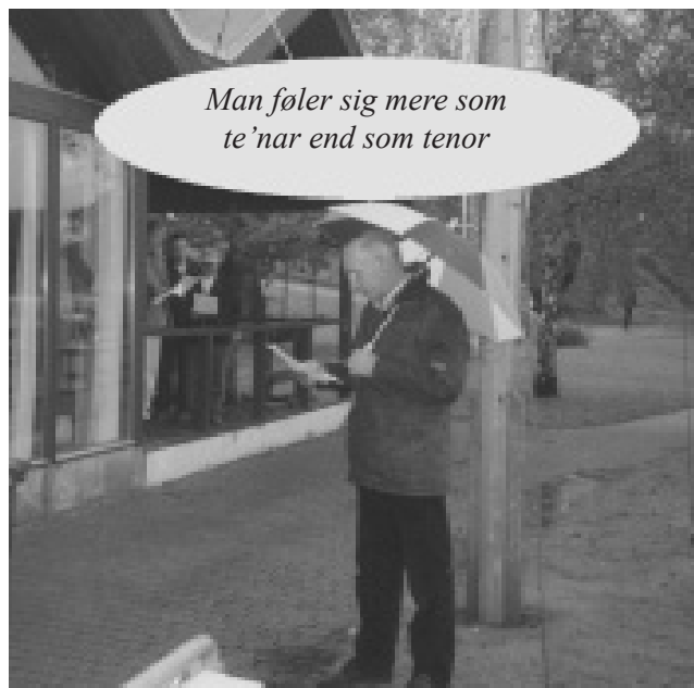
Singing in the rain!

Mon de skulle prøve at krydse næste gang, de skal til Ry???