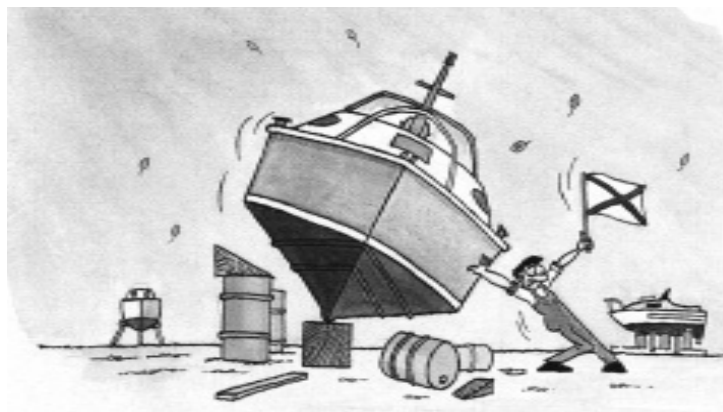
Flag V: Jeg ønsker hjælp!