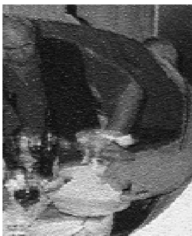
Birgers foto ved Pigemad

Den var så stille og diskret, at man ikke bemærkede dens tilstedeværelse før nogen trak en øl. Disse dyder genfinder man absolut ikke hos dens afløser.