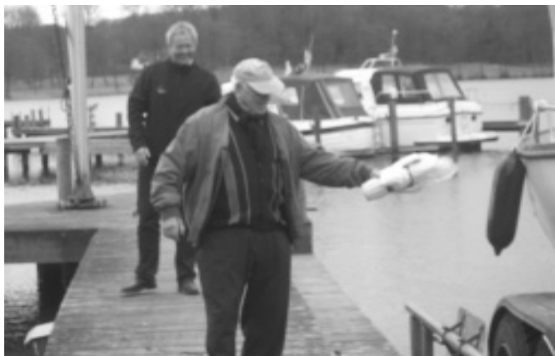
Standerhejsning og dåb på samme dag