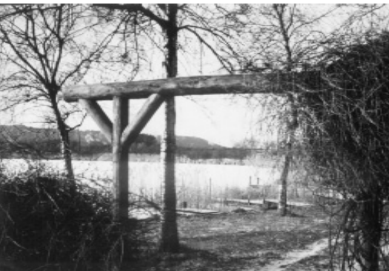
Det gamle Ry Bådlaug