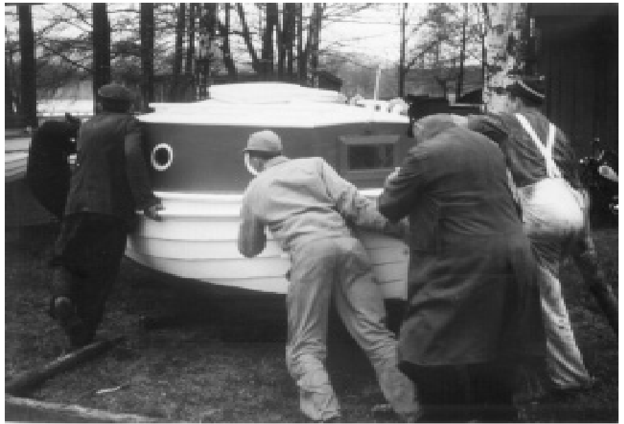
Bådene skal i vandet