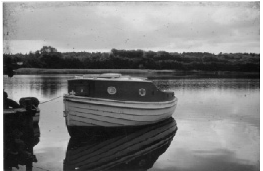
Elkærs båd i vandet