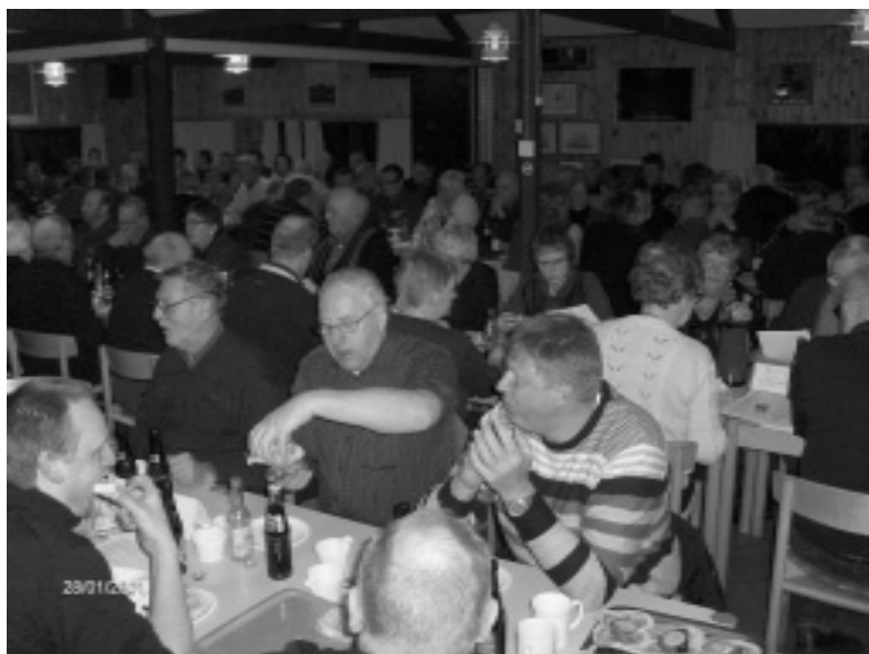
Som altid - godt fremmøde!