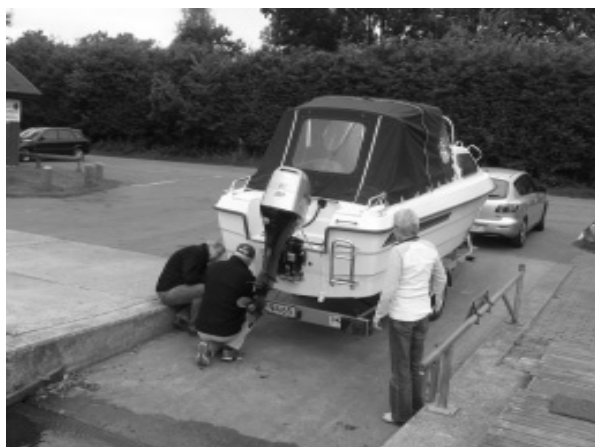
Der gøres klar ved slæbestedet.