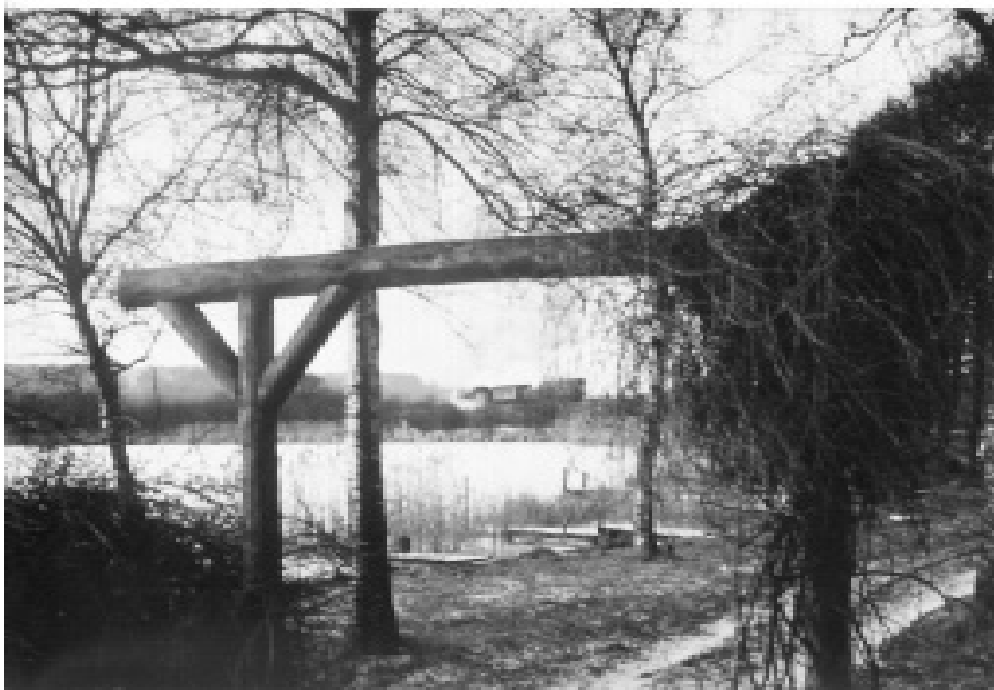
Dengang var det sparsomt med broer - men toget var der ! (se i baggrunden)

Så du billedet på forsiden? Det er taget 10 år før laugets stiftelse, og meget er sket siden da. Ry Bådlaug bliver 40 år i år. Sommerfesten i år bliver derfor særlig festlig, idet vi fejrer bådlaugets 40 års jubilæum. Den begivenhed vil der blive gjort lidt ud af, men vi røber ikke for meget. Det ligger dog fast, at hovedmenuen bliver helstegt pattegris, og at der bliver lidt underholdning i løbet af aftenen.