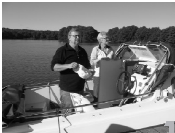
Og så er vi på vej... nøen, går der godt en time. Så