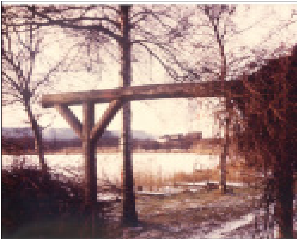
Ry Marina anno 1959