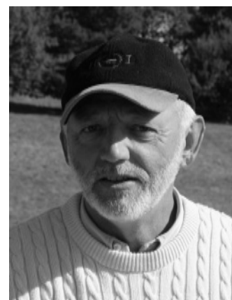
Chr. Medom Redaktionsudvalget