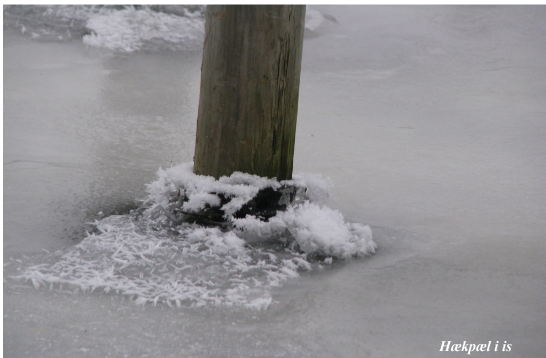
Hækpæl i is