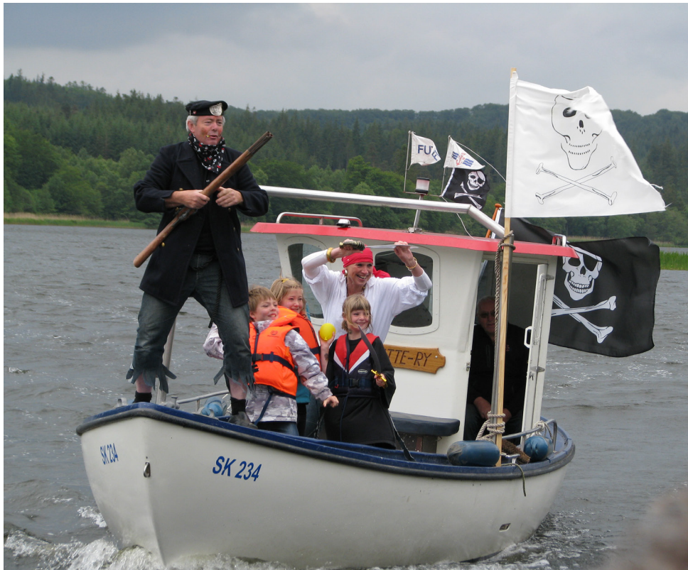
Piraterne kommer !