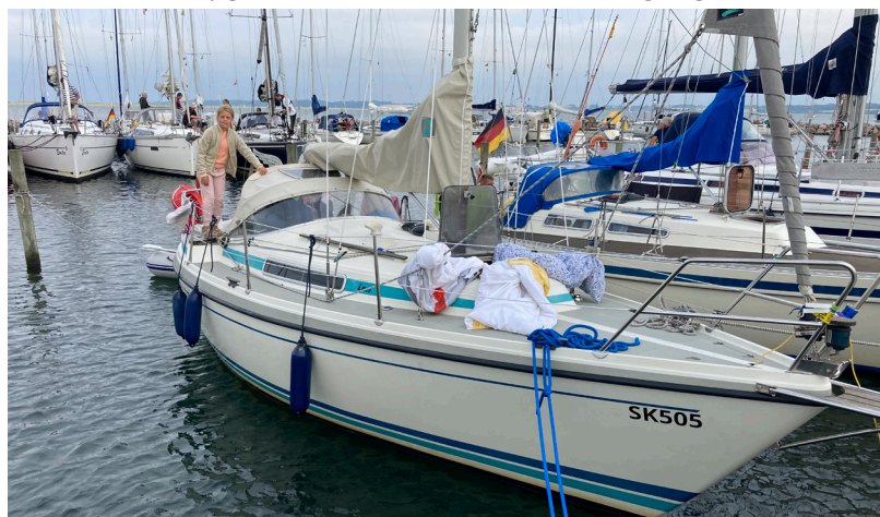
Det gode skib „Martha“

Anne og Sørens (A og S) båd lå på tankningspladsen, da der ikke lige var nogle både, der skulle tanke, da vi ankom. Men lidt senere kom der en stor lækker 37 fods sejlbåd med far, mor og 2 børn ombord. De ville gerne tanke lidt, så A og S flyttede deres båd, så de andre kunne komme til. Alt gik sådan set som det skulle, lige indtil den flotte 37 fods båd skulle derfra igen. Vinden var taget lidt til og stod lige ind på havnemolen, da den fine store 37 fods sejlbåd skulle ud. Det så virkelig pro ud i starten, faren havde styr på det, trykkede lidt på bovpropellen og så bare derudad. Konen var placeret i stævnen, og af mærkelige årsager undervurderede kaptajnen vindens kraft og måske også hans bovpropels evner, fordi han ”vælger” at sejle ind i vores Martha, hvor de på forunderlig vis får et af septorerne til søgelænderet bukket ind over skibet med en revne i gelcoaten på ydersiden til følge!!! Tror nok lige feriestemningen blev vendt 180 grader! Stemningen blev lidt højroset. De sejlede så væk til deres plads i inderhavnen og kom tilbage efterfølgende. Vi fik skrevet for-