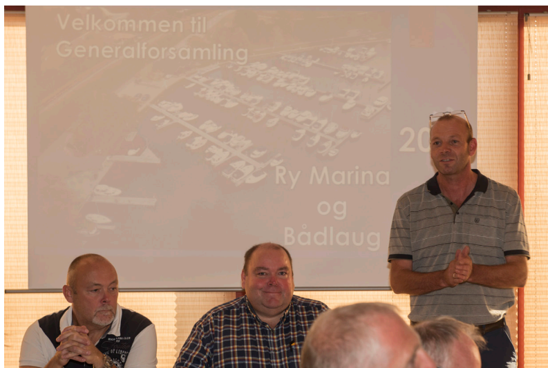
Formanden byder velkommen