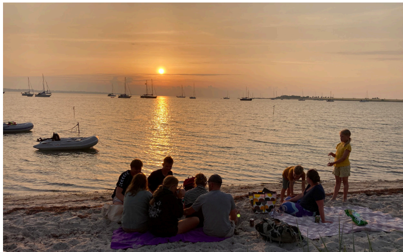
En smuk sommeraften med masser af både for anker

Dagen efter gik turen videre. Ikke så langt, men blot en tur på 3-4 sømil om til en bugt lidt nordvest for Ærøskøbing. Her smed vi anker alle både, nu fire både samlet. Vi smed anker langt inde på omkring to meters vand. Som første gangs "vi lægger anker ud og sover der" var der lidt bekymringer hos kaptajnen på Martha. Men efter at have dykket ned og tjekket ankret om det lå godt nok og overbevisninger fra de andre mere erfarne skippere om, at det nok skulle gå, faldt der lidt mere ro på kaptajnen. Til at få pulsen helt ned var der ud over det obligatoriske glas rødvin på ferien, også hjælp fra en ankeralarm installeret på telefonen, som gerne skulle vække kaptajnen, hvis båden skulle drive mere end den radius, der var ind-