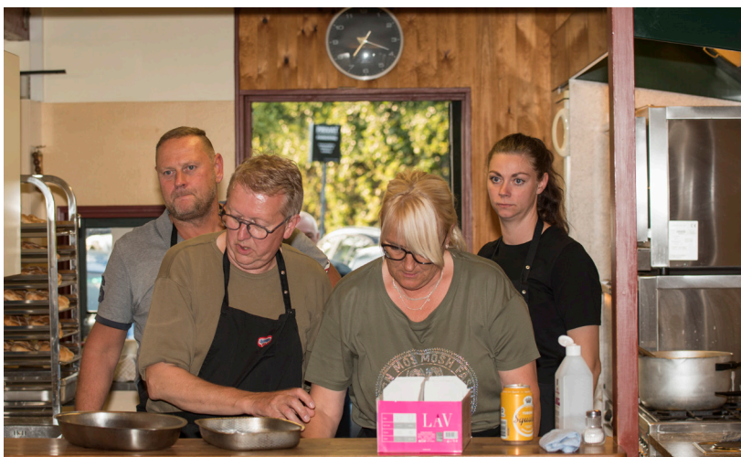
Festudvalget sørgede for fornem forplejning