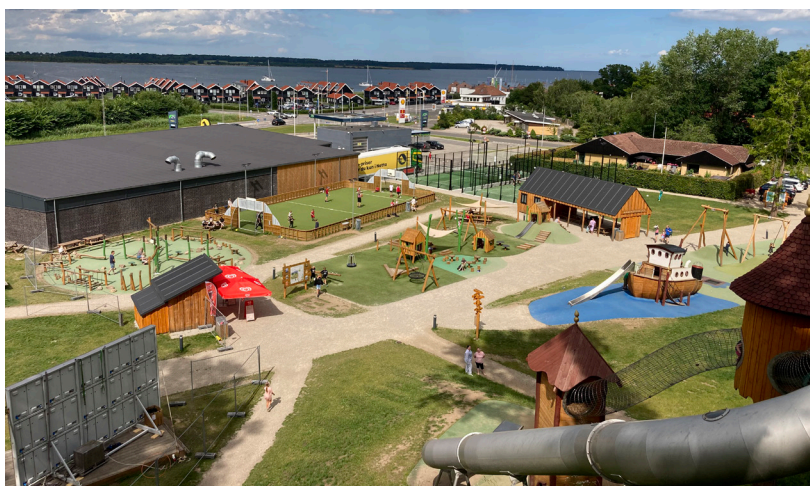
Den store nye legeplads i Juelsminde

Men selvom der var vind, var der samtidig sol, sol og atter sol. Man var derhenne, hvor en brise gjorde godt, så både ungerne og de voksne var kommet til en næsten øde ø – eller kun de 50 både og så os! - med tropisk vejr og lækker badestrand. Og minsanden om de indfødte ikke havde etableret en købmand, der både handlede med is og kolde øller. Så kan man næsten ikke forlange mere! Lyø har virkelig noget at byde på i form af f.eks. det fantastiske skrønemuseum, hvor vi fik fortalt spændende historier fra sømandsenken ude i hendes have - en uforglemmelig oplevelse! Det kan vi varmt anbefale. En anden spændende ting, vi så, var den største og bedst bevarede