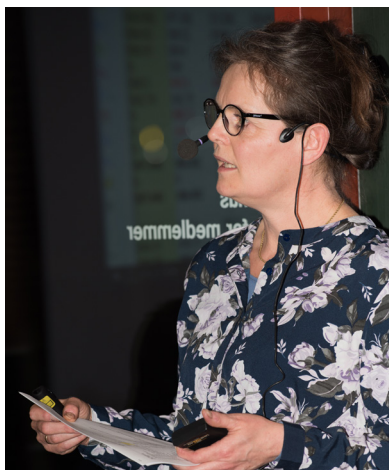
Kassereren gennemgår regnskabet

Der er i 2018 konstateret et svind ved salg af diesel svarende til et beløb på ca. DKR 12.500. Det har ikke været muligt at lokalisere