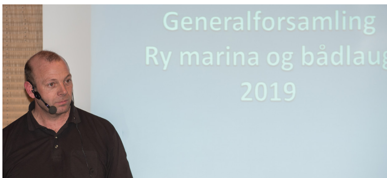
Formanden byder velkommen

Mobilepay er etableret på havnekontoret på nr. 79539. Derudover arbejdes der på at få en online udgave af administrationsprogrammet Winkas, hvilket vil åbne op for mulighed for online indmeldelse i klubben.